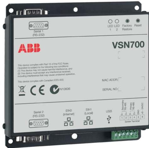
ABB Überwachung und Kommunikation VSN700 Data Logger